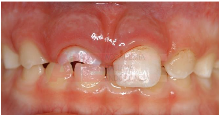
Immagini di denti lussati dopo il trauma